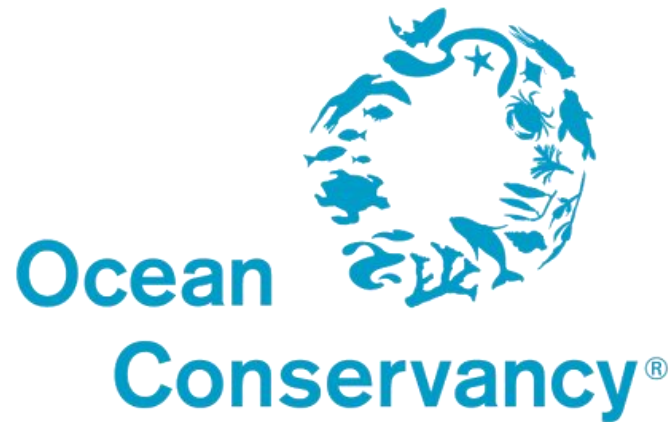
海洋保护组织 (Ocean Conservancy)